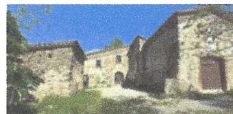
Reforma masia Can Auleda. Ajuntament Sta Ma de Palautordera.