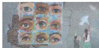
Climatització, Espai cívic Can Gibert. Ajuntament de Girona.