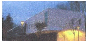
Reforma banys guarderia El Blauet. Ajuntament de Sant Celoni.