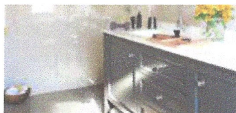
Reforma de banys. Ajuntament de Martorelles.