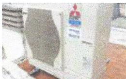
Aire condicionat biblioteca. Ajuntament de Caldes.