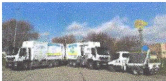
Gestió de vehicles Préssec. Ajuntament de Gavà.