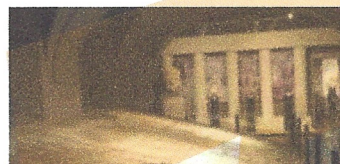
Climatització Museu d'Història. Ajuntament de Girona.