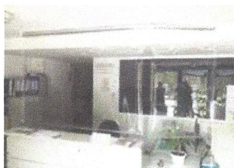
Mampares policia local. Caldes d'Estrac.