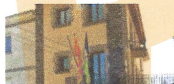
Canvi enllumenat. Ajuntament de Fogars de Montclús.

Confiam amb que ens contacteu i ens feu arribar les vostres necessitats. josep@arafinques.com