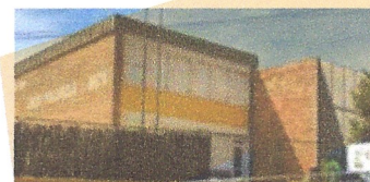
Instal·lació elèctrica cuina escola Pallerola. Ajuntament de Sant Celoni.