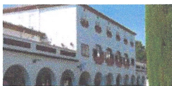
Centre cívic Sant Narcís. Ajuntament de Girona.

Balmes, 23 - 08470 Sant Celoni · Telèfon 938 675 823 · arafinques@arafinques.com · www.arafinques.com