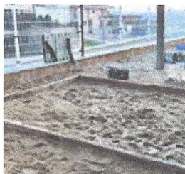
Construcció de sorral. Ajuntament de Palau-saverdera.