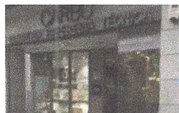
Instal·lació vidres aparadors. Llibreria Carbó. Granollers.