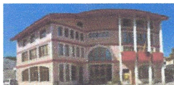
Reforma de tres habitatges. Ajuntament de La Cellera de Ter.