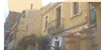
Reforma integral de vivenda. Ajuntament de Vilassar de Dalt.