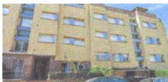
Reforma integral de vivenda. Ajuntament de Tossa de Mar.