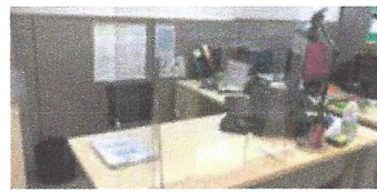
Mampares policia local. Ajuntament de Sant Pol de Mar.