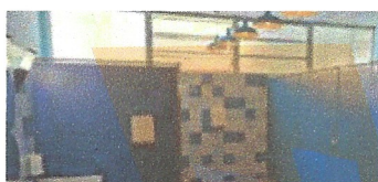
Reforma lavabo escola. Fontmartina, Sta Ma de Palautordera.