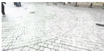
Construcció de voreres. Ajuntament de Llinars del Vallès.