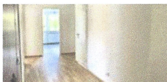
Reforma de 3 habitatges socials. Ajuntament de Ripollet.