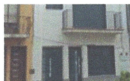
Constucció 2 habitatges d'obra nova. Sant Celoni.