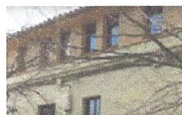
Adequació Casal del Poble. Ajuntament de Vallgorguina.