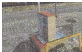
Zona de càrrega i descàrrega d'aigua àrea d'autocaravanes. Ajuntament de Sant Celoni.