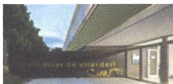
Instal·lació splits escola Soler de Vilardell. Ajuntament de Sant Celoni.