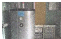
Interacumulador de 500 litres. Ajuntament d'Esparreguera.