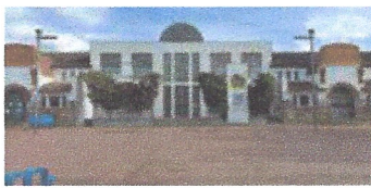
Reforma escola Agustí Gifré. Ajuntament de Sant Gregori.

Balmes, 23 - 08470 Sant Celoni · Telèfon 938 675 823 · arafinques@arafinques.com · www.arafinques.com