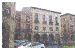
Reforma de l'OAC. Ajuntament de Manlleu.