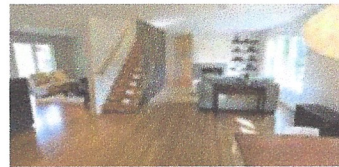
Reforma general de vivenda. Sant Celoni.