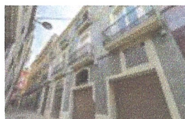
Reforma integral de vivenda. Ajuntament Vilafranca del Penedès.