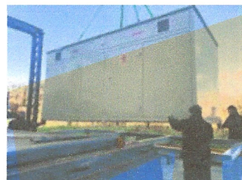
Caldera empresa Velcro. Argentona.