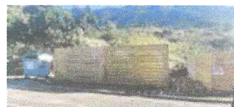
Construcció de punts verds. Ajuntament de Palau-saverdera.