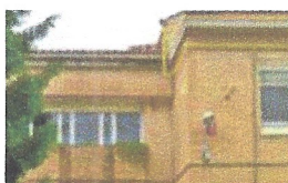
Reforma instal·lacions escola. Fontfreda, Montcada i Reixach.