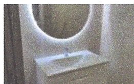
Reforma integral d'habitatge. Ajuntament Sta Ma de Palautordera.