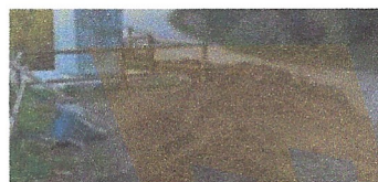
Tram de línia - Cobra, instal·lacions y servicios Sau.