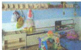
Climatització llar d'infants. Ajuntament de Sant Gregori.