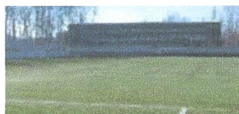
Reforma banys i accés al camp de futbol. Consell comarcal del gironès, Girona.