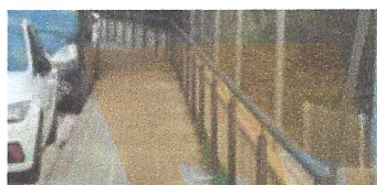
Construcció barana c/ Joaquim Costa. Ajuntament de Sant Celoni.