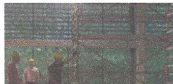
Diagnòstic vigues fusta, Gimnàs UFEC. Ajuntament de Sant Celoni.