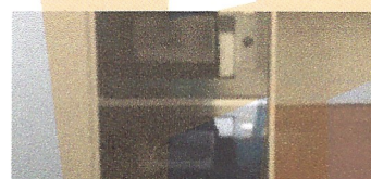
Instal·lació d'electrodomèstics. Departament de Justícia de la Generalitat de Catalunya, Barcelona.