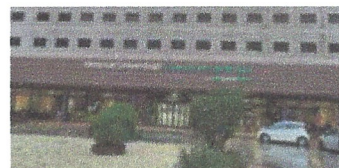
Reforma BOX. Hospital Universitari General de Catalunya.