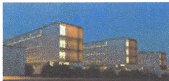
Eficiència energètica de l'hospital Moisès Broggi. Sant Joan Despí.