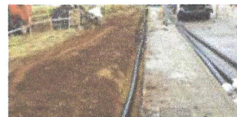
Instal·lació xarxa d'aigua potable. Castelló.