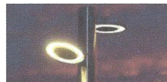
Subministre i col·locació de llums. Ajuntament de Llinars del Vallès.