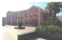
Instal·lacions climatització. Ajuntament de Calonge.