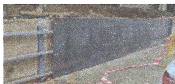
Mur d'acer corten, Puigdollers. Ajuntament de Sant Celoni.