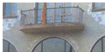
Climatització nau Tortuga.. Ajuntament de Dosrius.