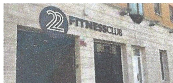
Realització bany 22@, Fundació Claror. Sta Ma de Palautordera.